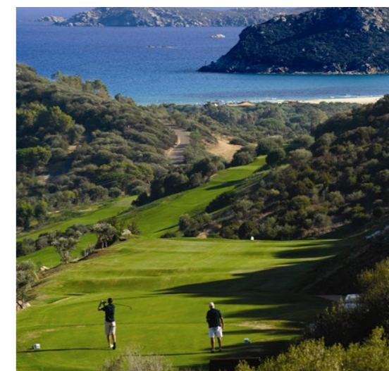
Tanka Golf Villasimius (Sardinien)