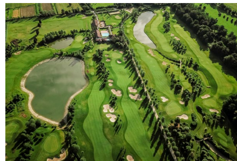
Le Pavoniere (Toscana)

Medelhavets näst största ö Sardinien är en förunderlig mix av generös lyx och mustigt rustik landsbygd. Ön kantas av fantastiska