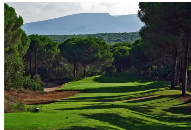
Is Arenas (Sardinien)