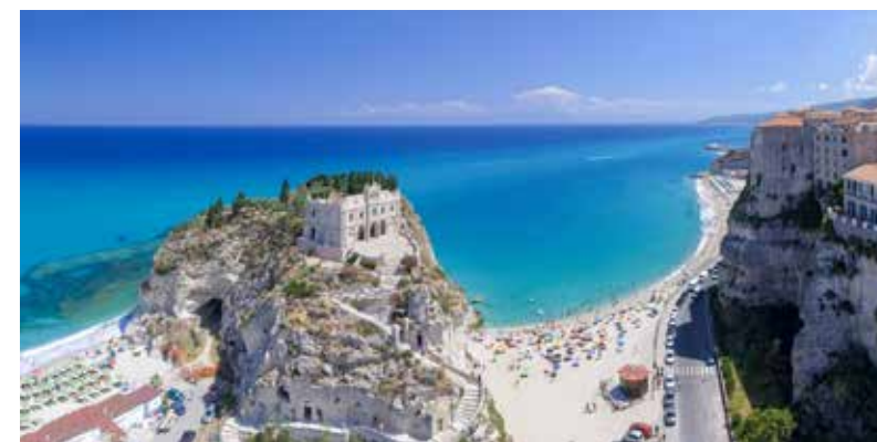
Accrochée à la falaise, la charmante Tropea domine les flots bleus et transparents de la côte calabraise.

Son passé antique vibre encore sur l'impressionnant site du cap Colonna, plus au sud. Là, sur ce vaste promontoire ouvert sur les flots cristallins de la plus vaste zone marine protégée d'Italie, s'ouvre le grand parc archéologique, dominé par le temple d'Héra Lacinia, reconnaissable à son unique colonne dorique restante sur les 48 du temple qui fut l'un des plus importants de Grande-Grèce. Jadis couvert de tuiles de marbre et orné de peintures du mythique Zeuxis, il a livré un important trésor d'offrandes votives (dont un magnifique diadème d'or conservé au musée de Crotona).