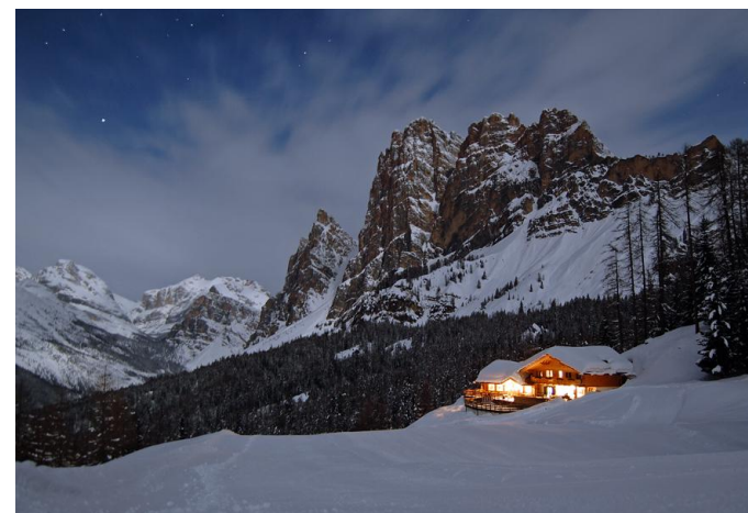
満点の星空

http://cortina.dolomiti.org/index.cfm/See-and-do/Astronomical-Observatory/