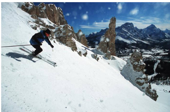
スキーのグレンデ