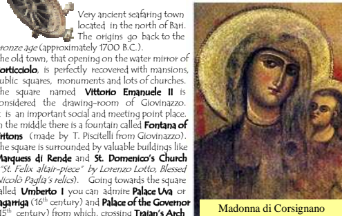
Madonna di Corsignano