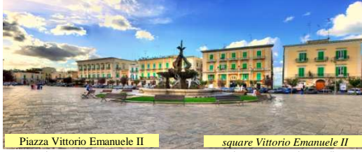
Piazza Vittorio Emanuele II square Vittorio Emanuele II