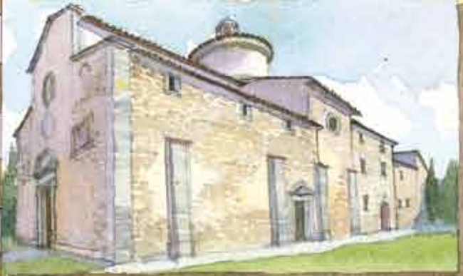
SANTUARIO DELLA MADONNA DELLA QUERCE - SEC. XVI