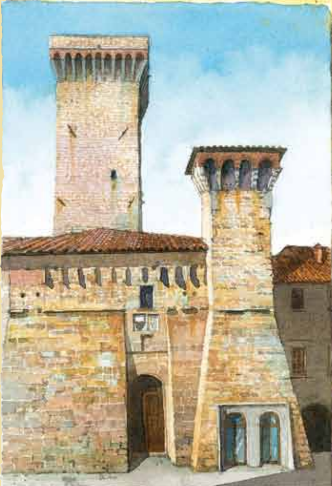
IL CASSERO TRECENTESCO