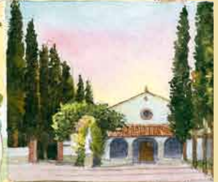
CONVENTO DEI CAPPUCCINI SEC. XVI