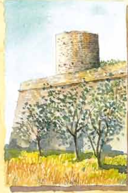
FORTEZZA MEDICEA SEC. XVI