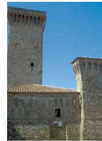
Lucignano, La Rocca

GRATUITI/Free • Via Circonvallazione (auto e autobus/car and bus) • AREA CAMPER Via Procacci