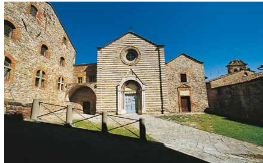
Lucignano, Chiesa di San Francesco

Although Second-World-War artillery severely damaged the main tower and walls of this castle built before the year 1000, Civitella remains one of the most typical examples of feudal architecture.