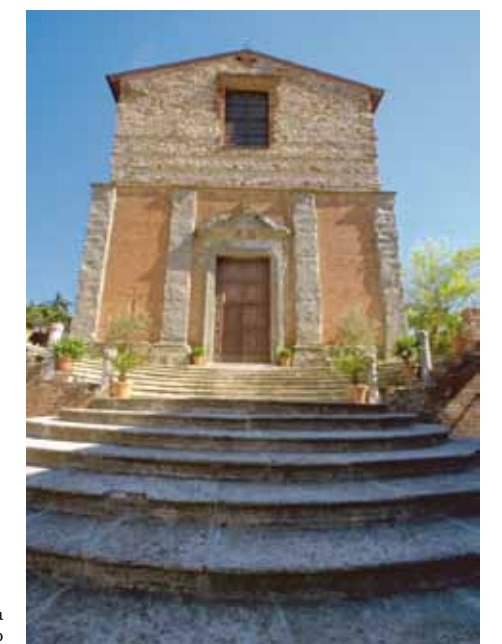
Lucignano, Chiesa della Collegiata di San Michele Arcangelo

Possibly of Roman origin, in the middle ages it became a castle with extensive walls, and a bustling town then grew up inside. It was the native town of the great renaissance sculptor Andrea Contucci, known as Il Sansovino, and Pope Julius III. There are many buildings of medieval and renaissance architecture, foremost among which are the church of San Giovanni Battista with an entrance door by Il Sansovino, the gothic church of Sant'Agostino with 15th century frescoes and paintings by Vasari, the Loggia del Mercato, a very attractive market fronted by the Palazzo of the Del Monte family (now the town hall) built by Il Sansovino. A short distance away is the castle of Gargonza (13th century) where the Ghibelline faction of Florence and Arezzo, including Dante Alighieri, assembled in 1304. Ceramic is the most typical handmade products of Monte San Savino.